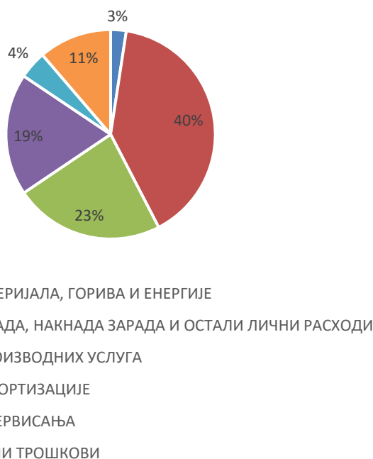
Учешће расхода у пословним расходима у 2023. години